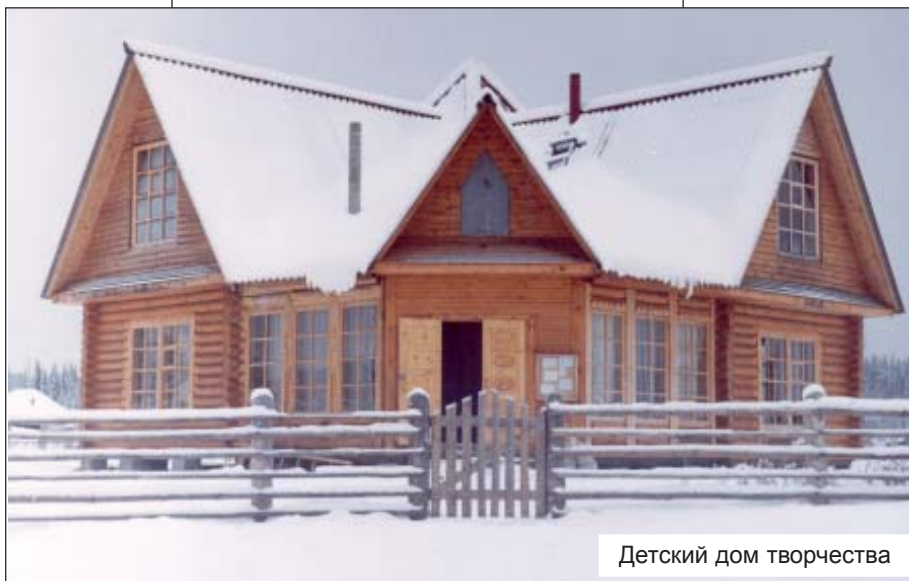
Детский дом творчества