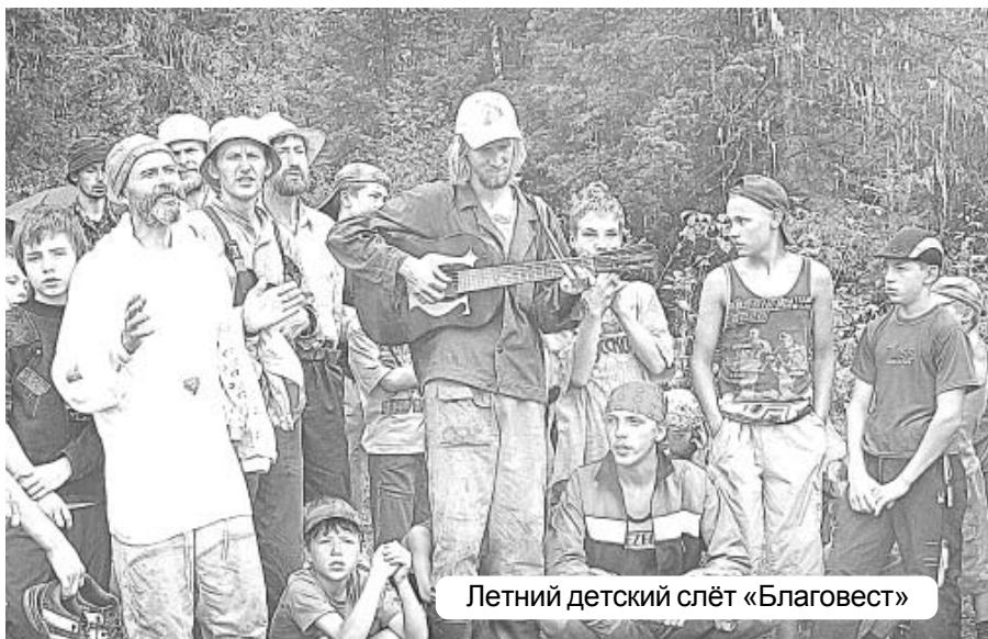
Летний детский слёт «Благовест»