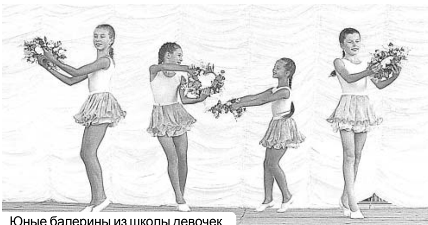
Юные балерины из школы девочек