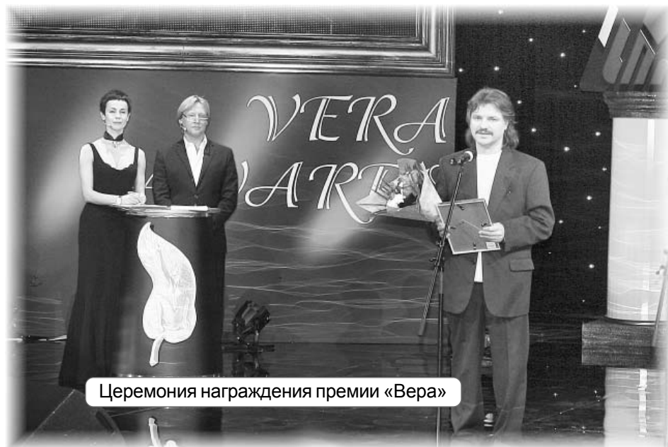
Церемония награждения премии «Вера»