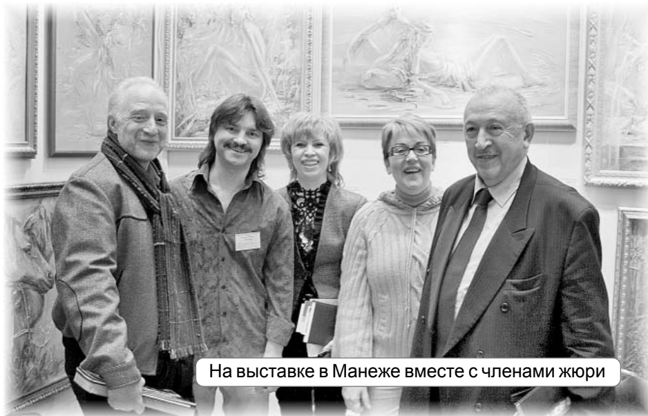
На выставке в Манеже вместе с членами жюри