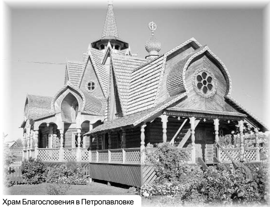
Храм Благословения в Петропавловке

Мне приятно, что наступило время, когда у многих людей появилась потребность создавать что-то красивое, ухаживать и заботиться о том, что уже есть. И