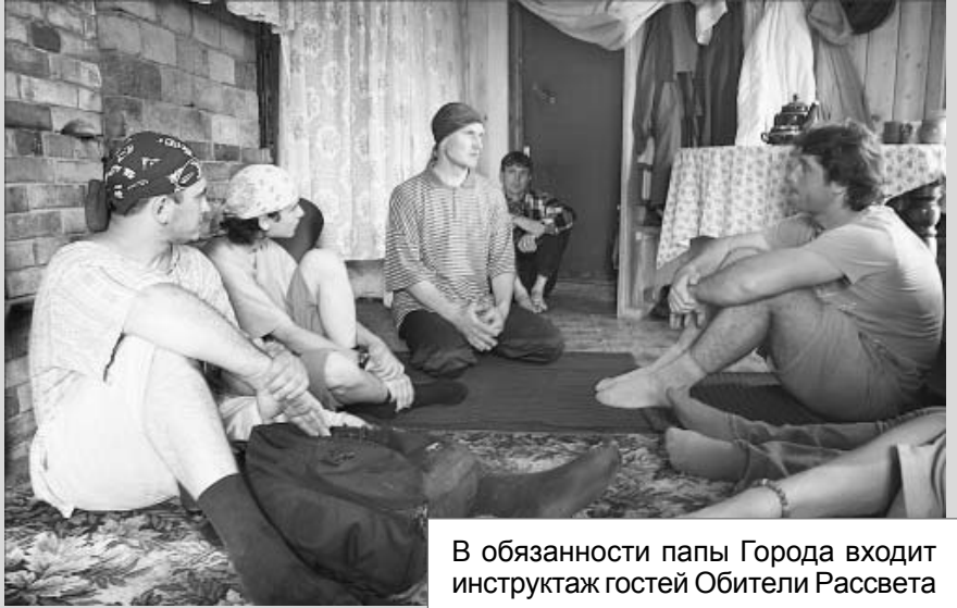
В обязанности папы Города входит инструктаж гостей Обители Рассвета

– Она – человек чувствительный и старается, насколько возможно, сама выстраивать всё гармонично. И я очень благодарен ей за это. Вообще, мы стараемся находить точки взаимопонимания, чтобы вместе гармонично всё решать.