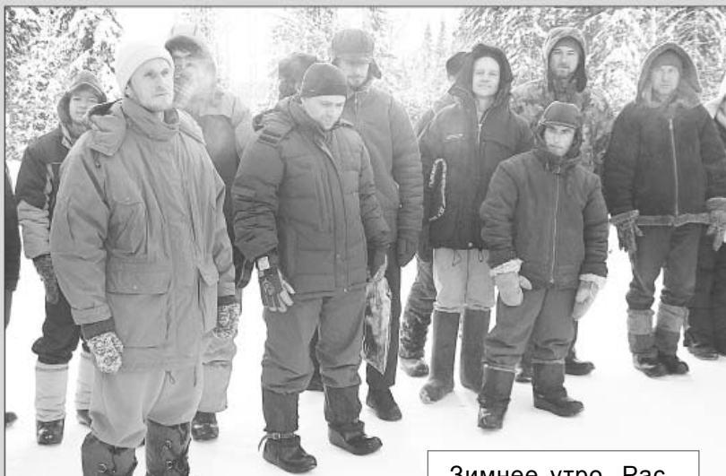
Зимнее утро. Распределение задач на предстоящий день

яние, которое мы должны теперь вернуть своими усилиями, преодолев слабости, трудности, создав Единую Семью.