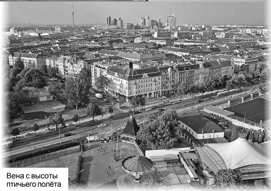
Вена с высоты птичьего полёта