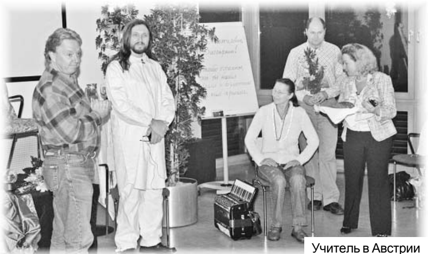
Учитель в Австрии