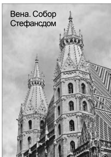
Вена. Собор Стефансдом