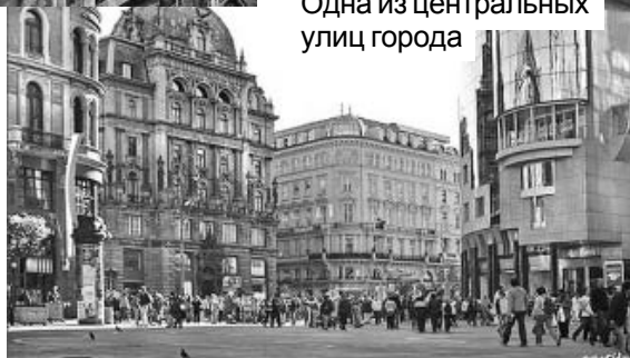
Одна из центральных улиц города