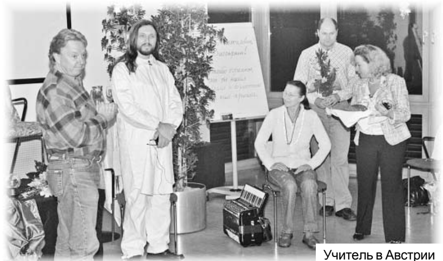
Учитель в Австрии