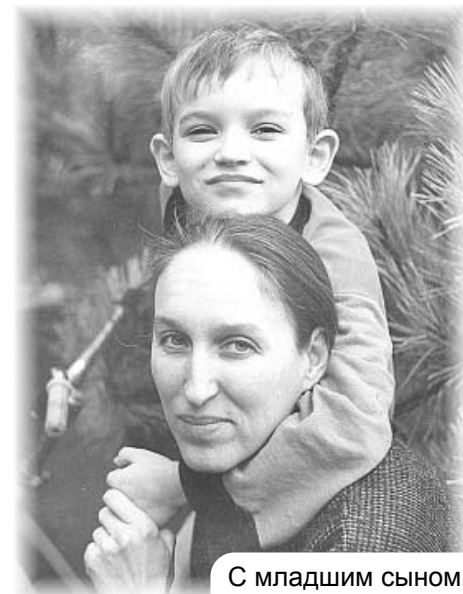
С младшим сыном

– Первое время я очень скучала, потому что привыкла к постоянному общению с ним. Поэтому сначала мы продолжали поддерживать с ним контакт – писали письма, созванивались. Но однажды он сказал мне, что больше не хочет скучать, потому что для него это слишком болезненно, и со временем, всё больше погружаясь в свою личную жизнь, он стал связываться со мной всё реже и реже. В какой-то момент мне стало очень больно внутри, никак не могла согласиться с таким положением вещей, которое мой разум оценил как разрыв наших доверительных отношений. Это стало для меня своеобразным экзаменом: смириться с тем, что он, как самостоятельная личность, больше не нуждается в моей опеке, и признать, что теперь надо продолжать бескорыстно помогать ему, не ожидая ничего взамен. Для эгоизма, которому казалось, что он столько вложил в этого ребёнка и заслужил хотя бы почтения, это было непростой задачей. Сейчас я понимаю, что просто изменилась форма наших отношений и моей задачей было осознать, что мы как были друзьями, так и остаёмся по сей день. Независимо ни от чего мы всегда друг у друга есть, и это самое главное.